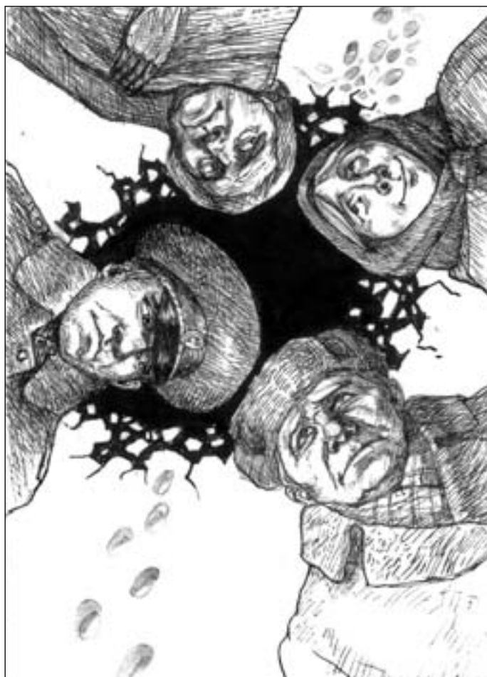
Иллюстрация Владимира ОВЧИННИКОВА