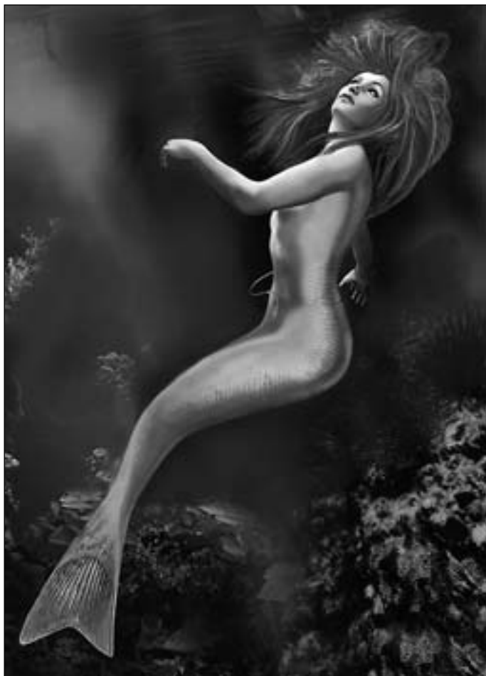
Иллюстрация Игоря ТАРАЧКОВА