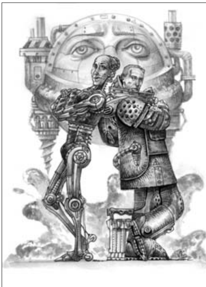
Иллюстрация Виктора БАЗАНОВА