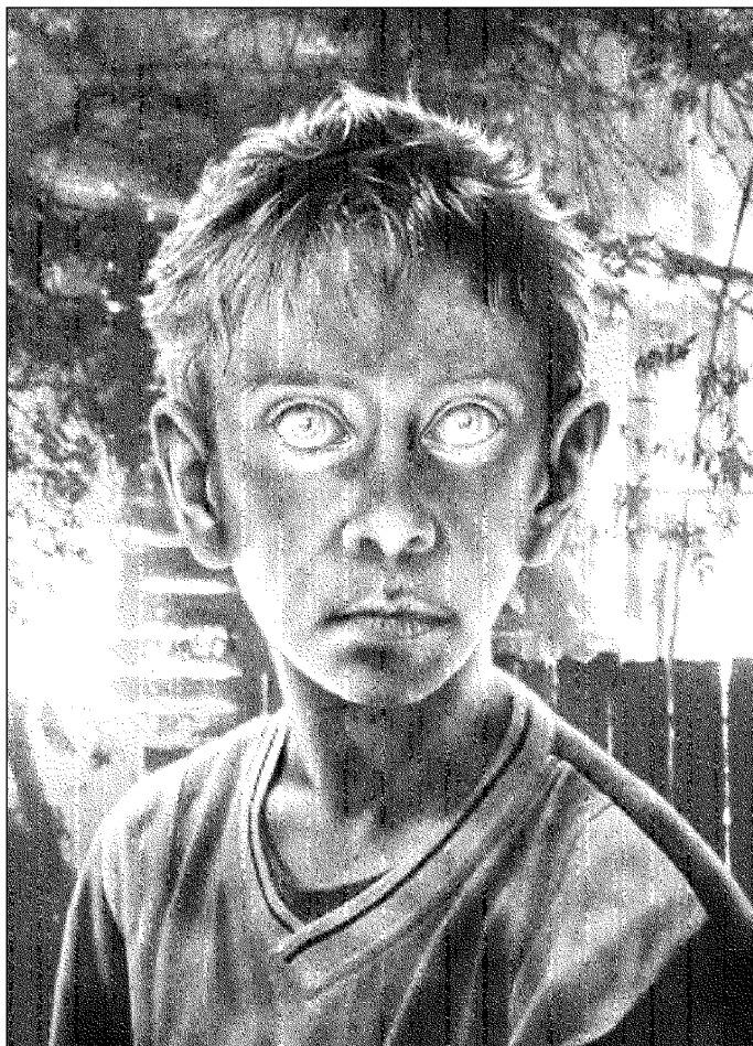
Иллюстрация Сергея ШЕХОВА