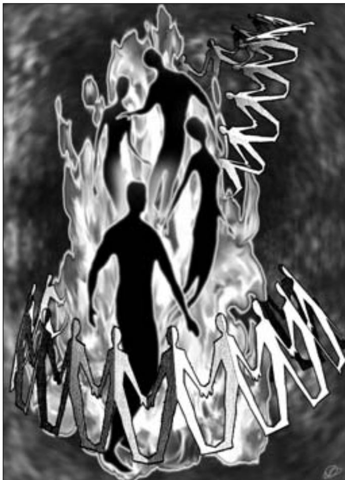
Иллюстрация Людмила ОДИНЦОВОЙ