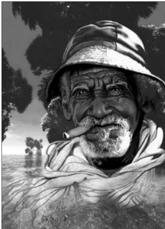
Иллюстрация Игоря ТАРАЧКОВА