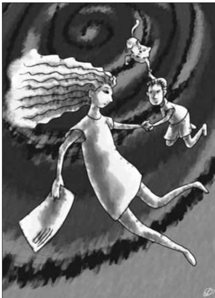
Иллюстрация Любимлы ОДИНЦОВОЙ