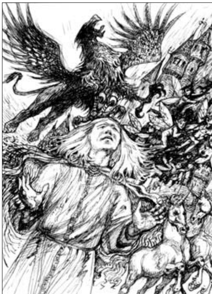
Иллюстрация Владимира ОВЧИННИКОВА