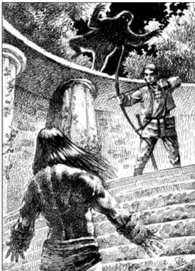
Иллюстрация Виктора БАЗАНОВА