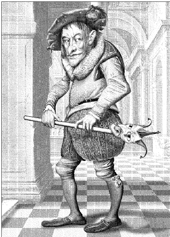
Иллюстрация Сергея ШЕХОВА