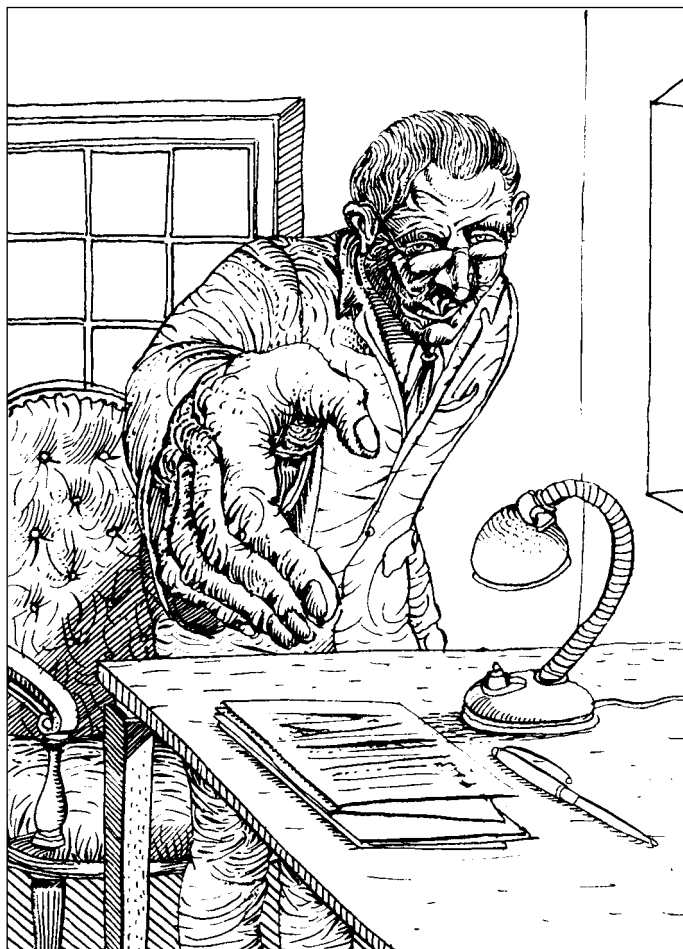
Иллюстрация Андрея БАЛДИНА