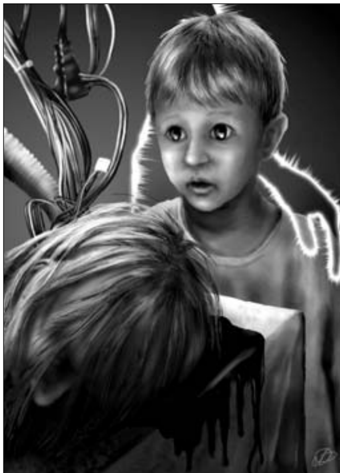
Иллюстрация Людмила ОДИНЦОВОЙ