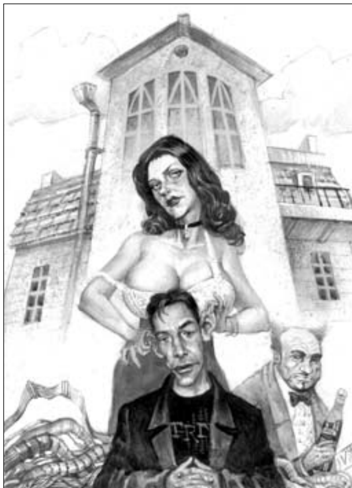
Иллюстрация Виктора БАЗАНОВА