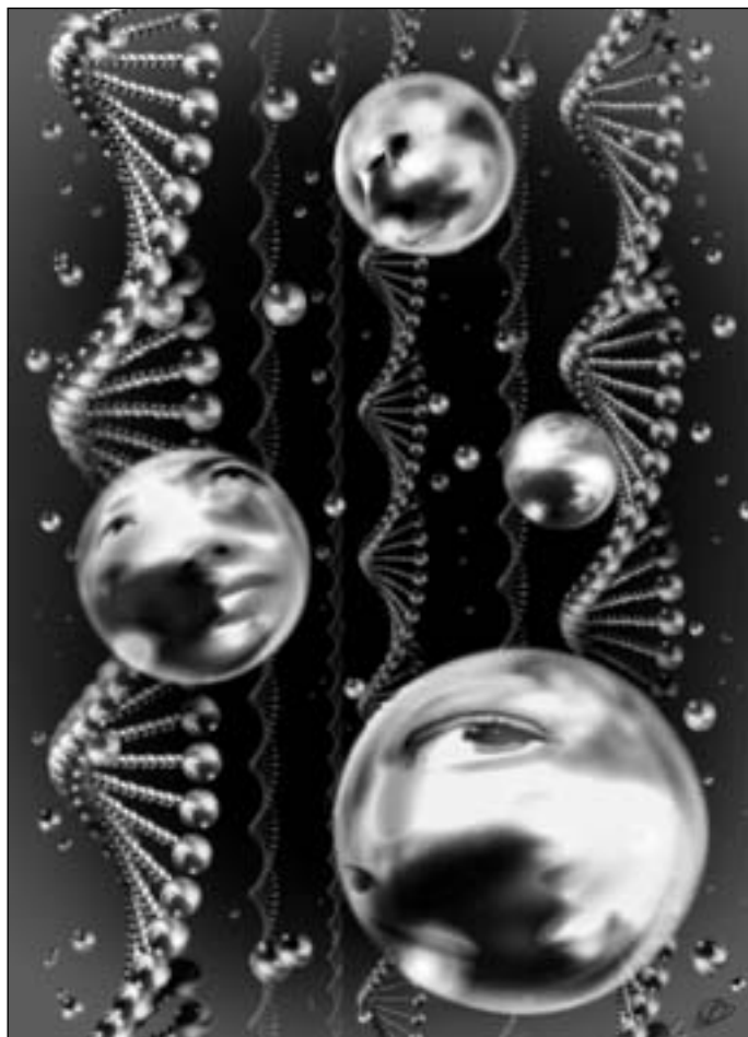
Иллюстрация Людмила ОДИНЦОВОЙ