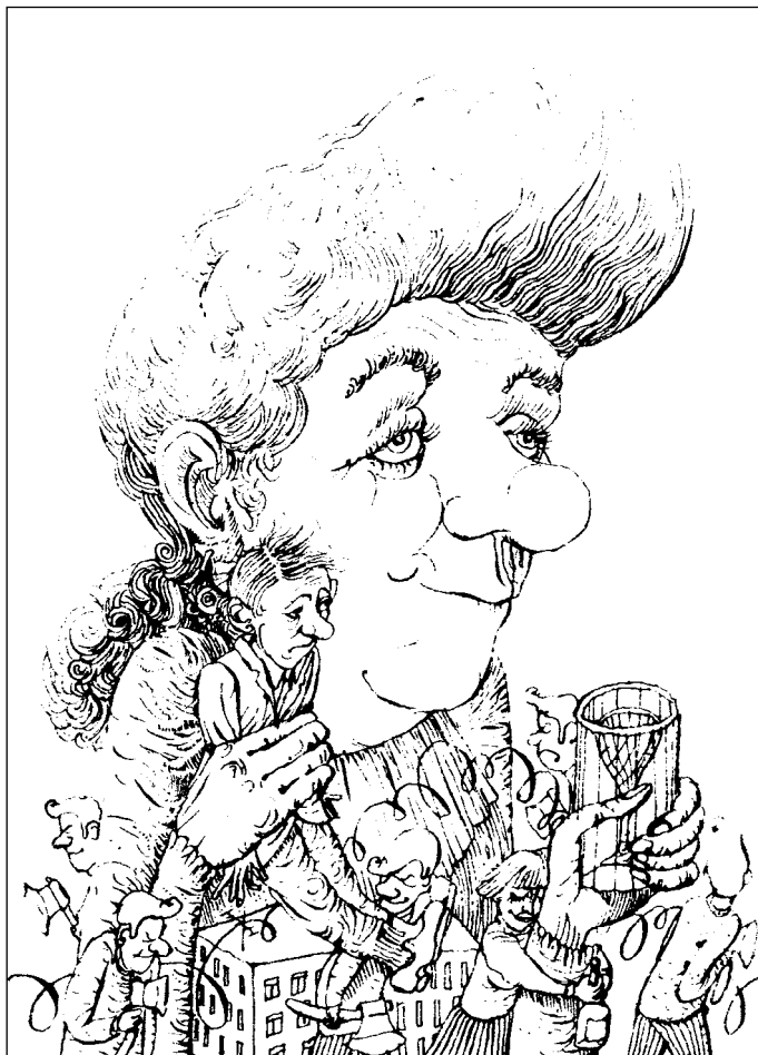
Иллюстрация Андрея БАЛДИНА