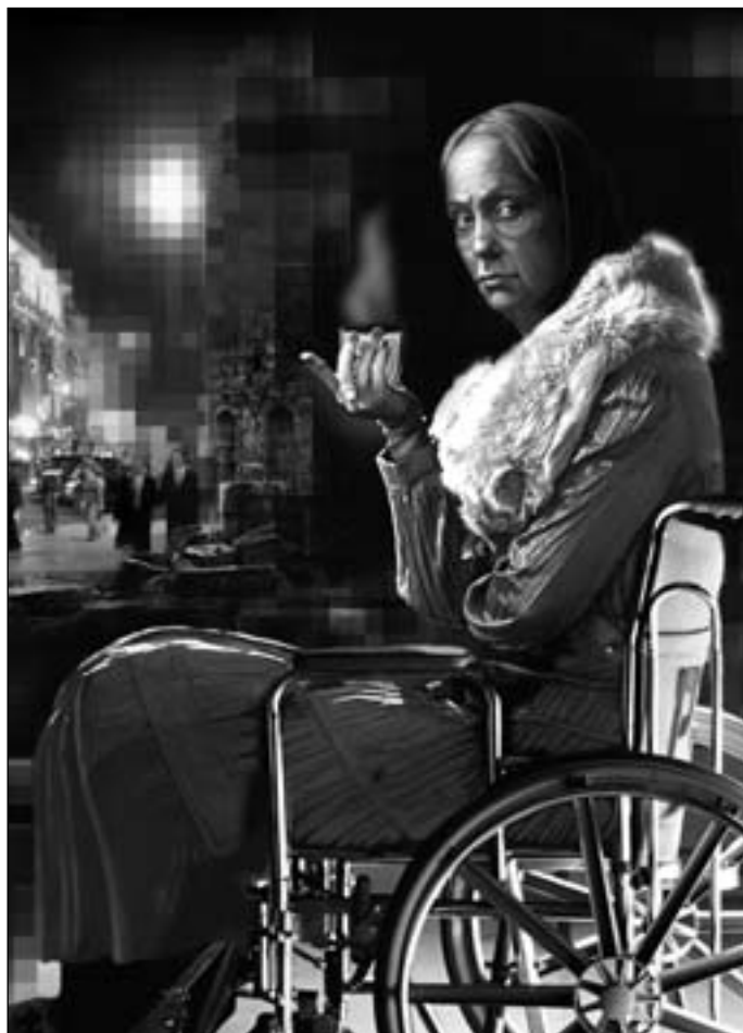
Иллюстрация Игоря ТАРАЧКОВА