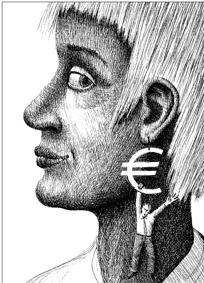
Иллюстрация Евгения КАПУСТЯНСКОГО