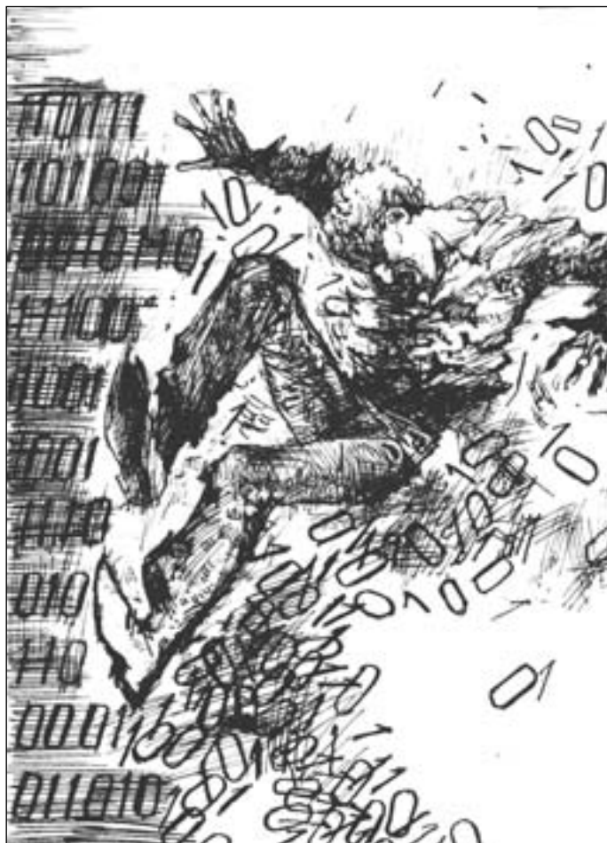
Иллюстрация Владимира ОВЧИННИКОВА