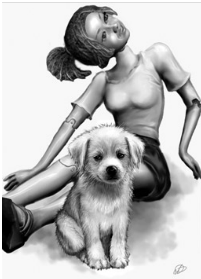
Иллюстрация Людмила ОДИНЦОВОЙ