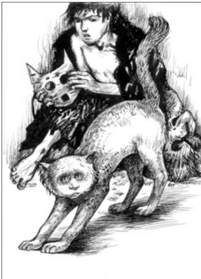
Иллюстрация Владимира ОВЧИННИКОВА