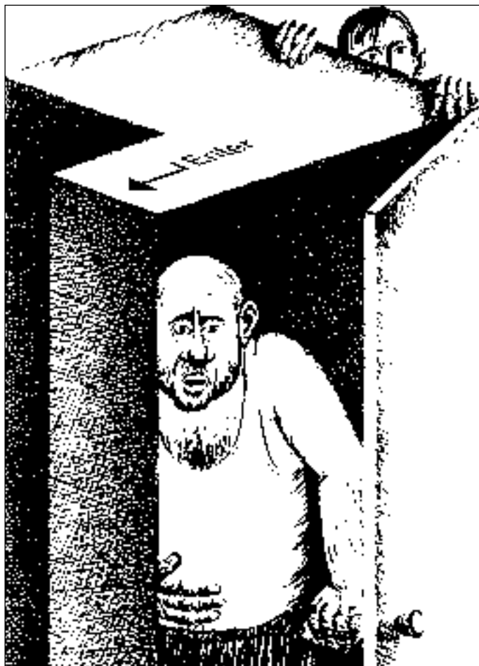
Иллюстрация Евгения КАПУСТЯНСКОГО