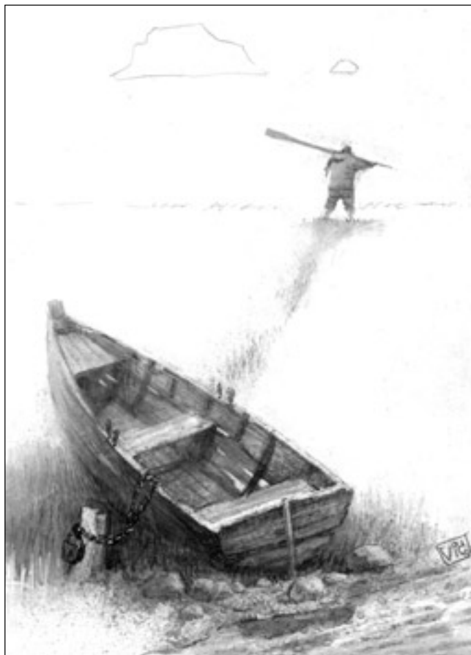
Иллюстрация Виктора БАЗАНОВА