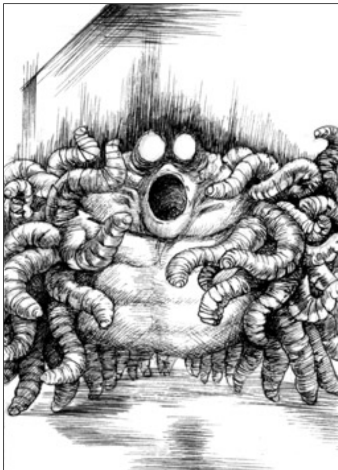
Иллюстрация Владимира ОВЧИННИКОВА