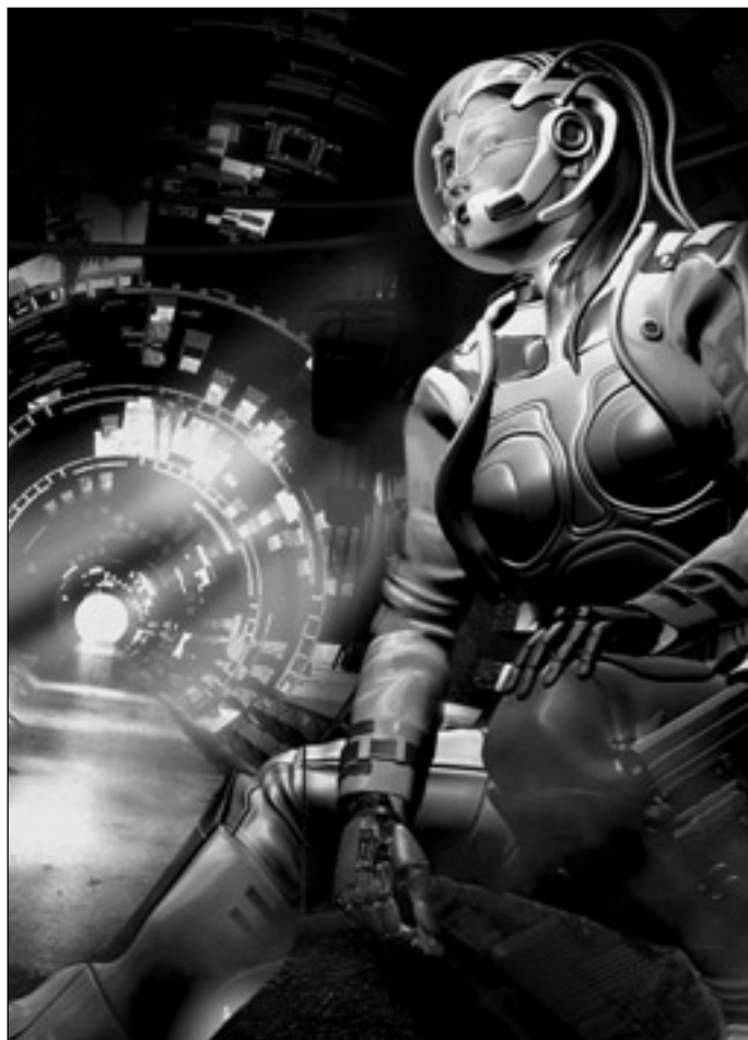
Иллюстрация Игоря ТАРАЧКОВА