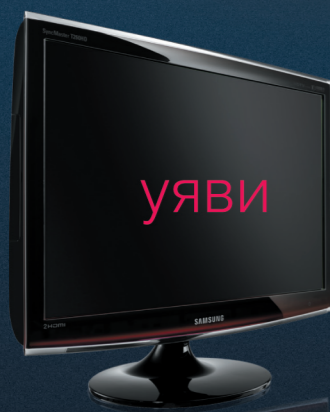
SyncMaster T190, T200, T220, T240