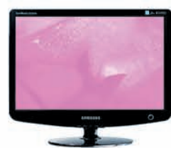
SyncMaster 2032BW / 2232BW

Інфо-служба Самсунг Електронікс: 8-800-5020000 (дзвінки зі стаціонарних телефонів в межах України безкоштовні) www.samsung.ua