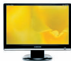
SyncMaster 206BW / 226BW

Монітори 206BW / 226BW та 2032BW / 2232BW від Samsung розкривають нові можливості. Тепер ще більше місця для роботи та розваг! Вони забезпечують найбільш зручний та природний для людського ока формат Wide , який зменшує втому та напругу для очей при перегляді. Динамічний контраст 3000:1 вражає надзвичайно насиченими кольорами зображення, а швидкість реакції матриці 2 мс дозволяє повному відчуті неймовірну реальність. Глянцеве покриття моніторів надає особливого комфорту під час роботи, а вишуканий дизайн задовольняє найвибагливіших. Очевидно, ці монітори варті вашої уваги!