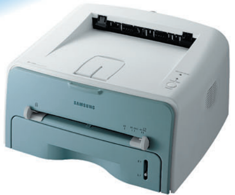
Принтери Samsung ML-1710, ML-1750