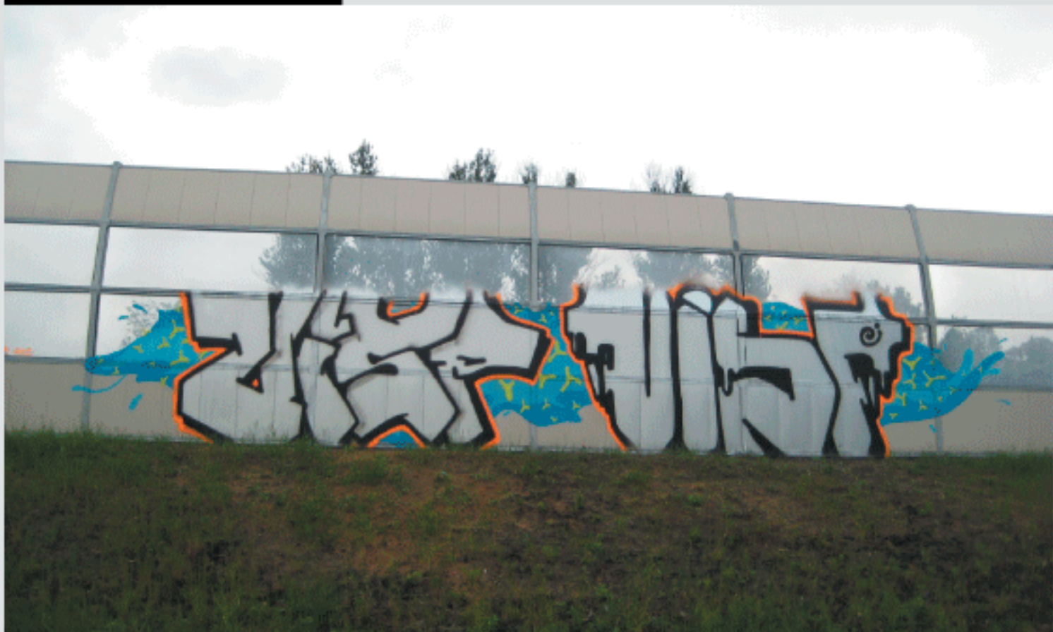
Emka VISP | Salek VISP