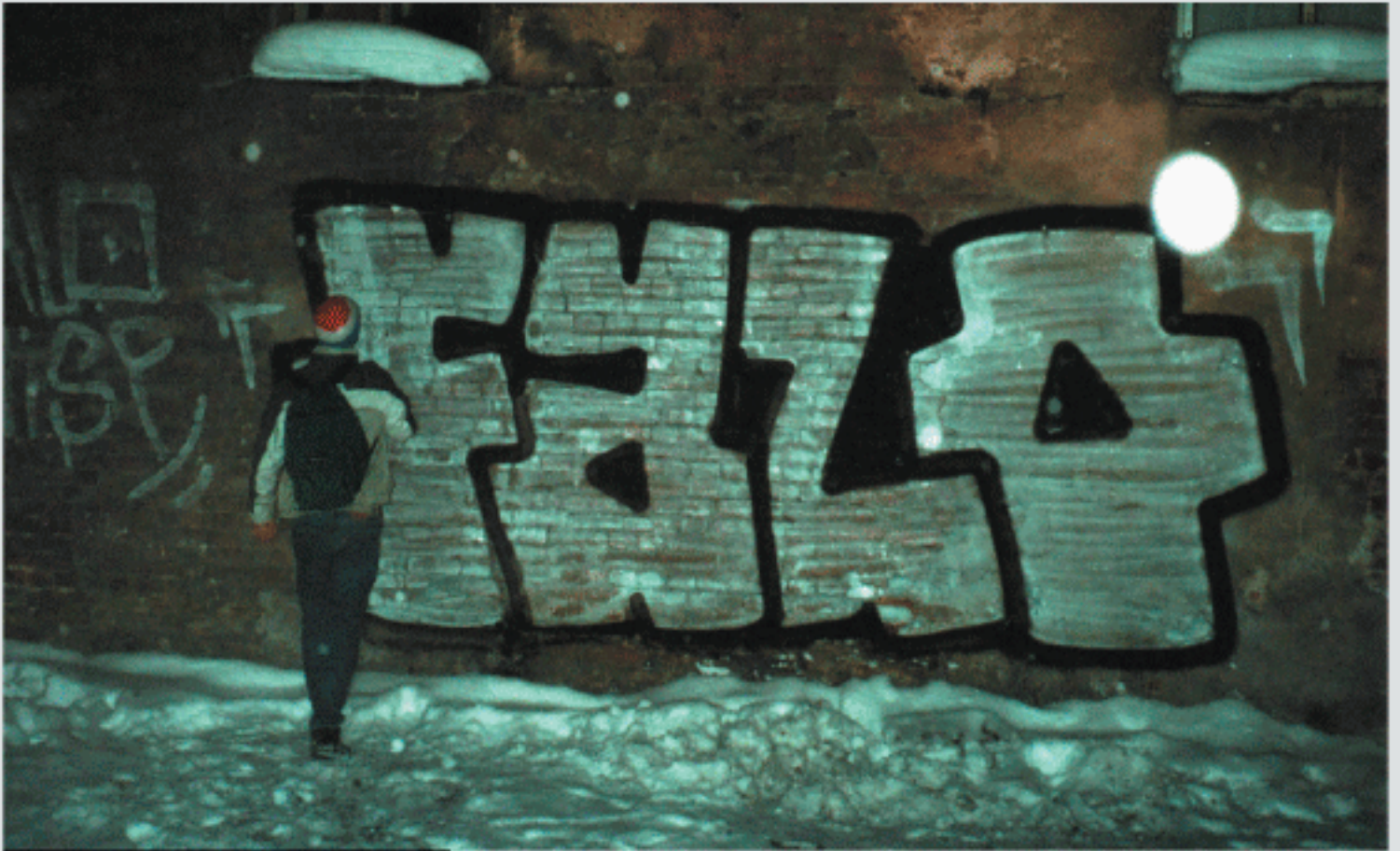
Eat18 FALO | Multi FALO VISP