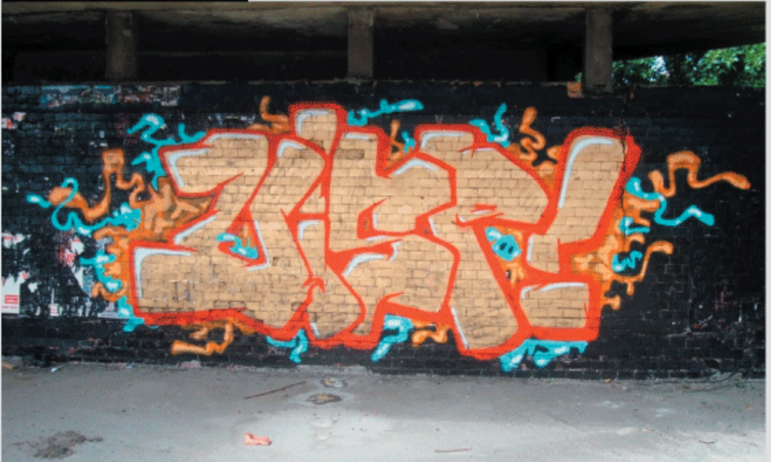
Emka VISP | Multi FALO VISP