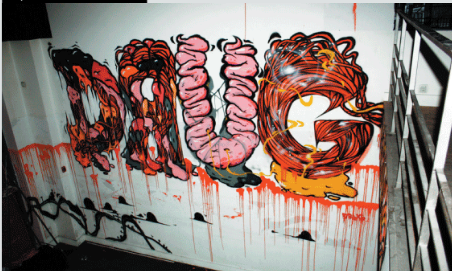
Multi FALO VISP