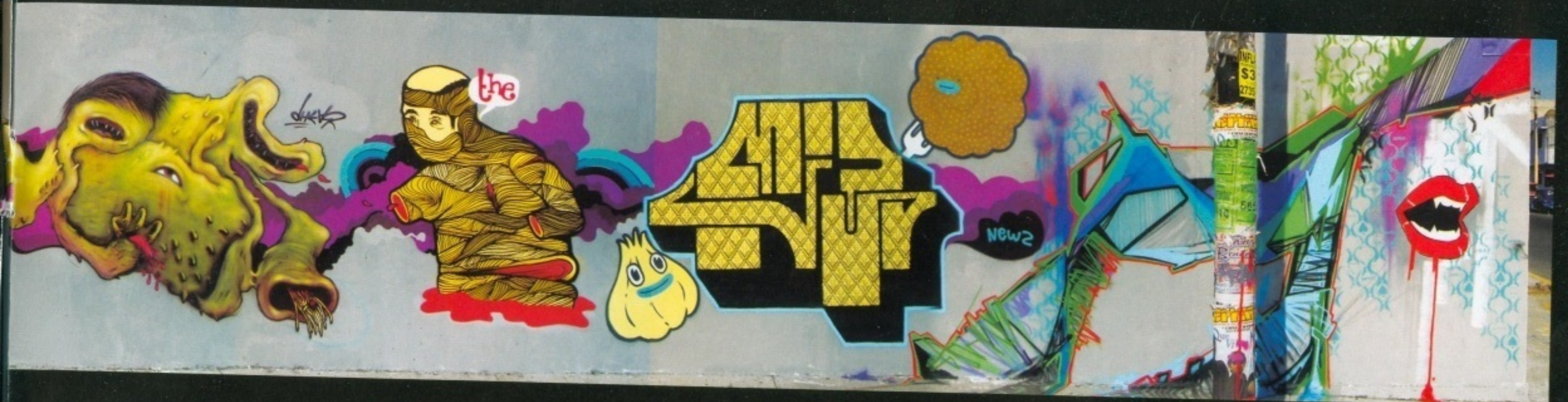
motik, smith, dear, news