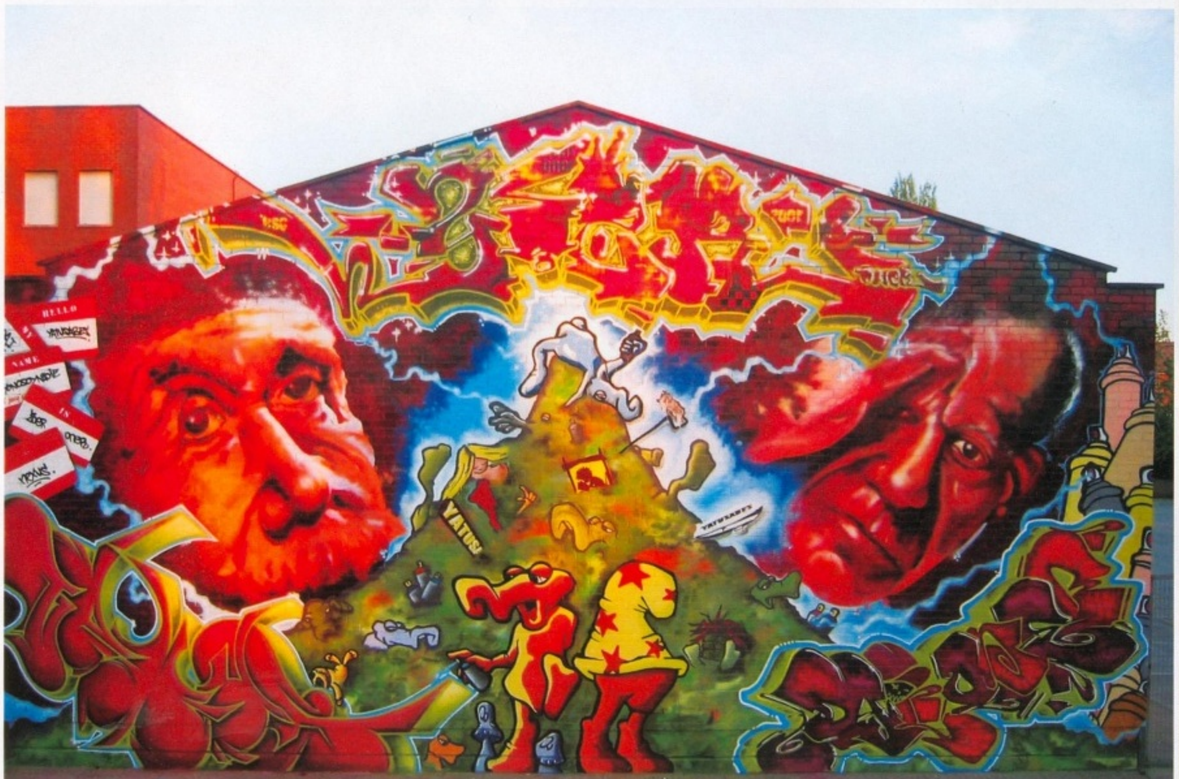
zoer, dai, oner, nexus_Chile