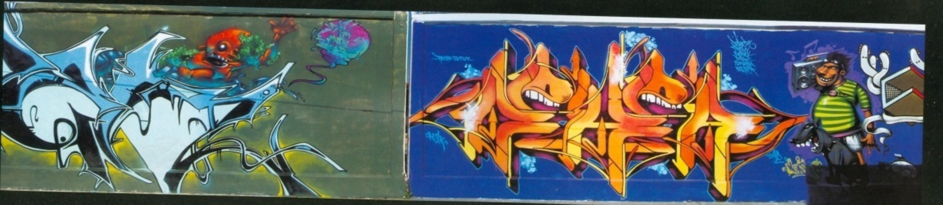
xpreso, weba, kosmo, mer, deker, noise