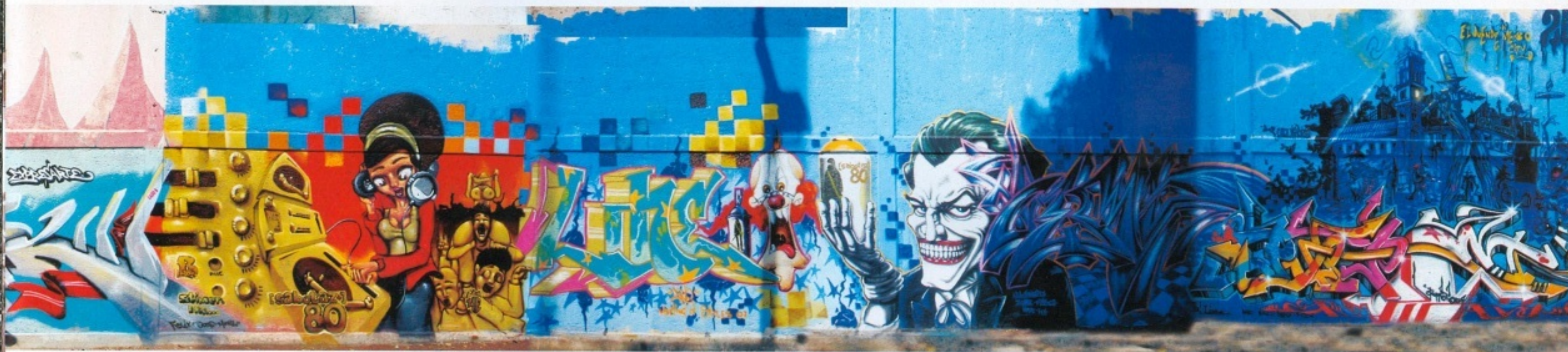
noble, bisa, hers, tren, reak, stimer, linea, puppet