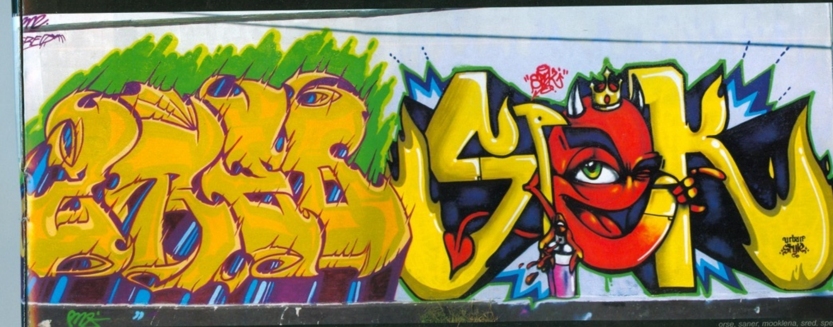
orse, saner, mooklena, sred, spek