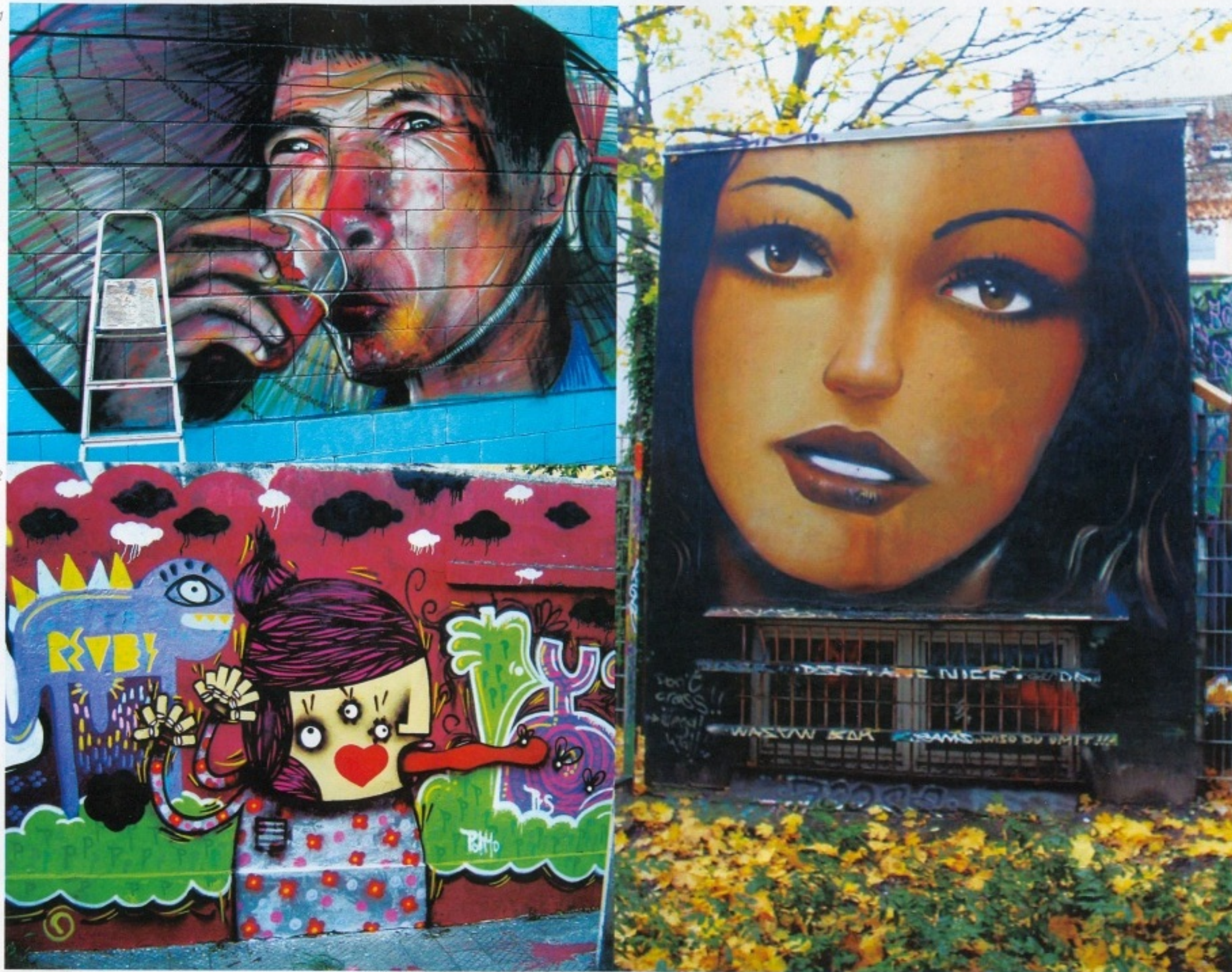
1.lady_Barcelona, 2.le-dorian_Chile, 3._Barcelona