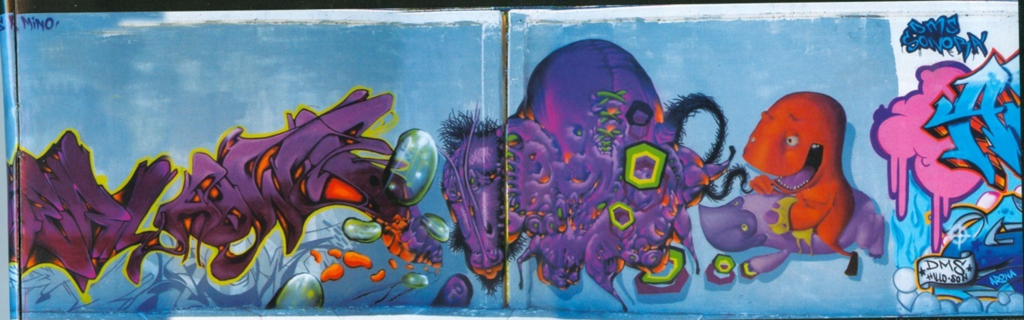
meiz, kliek, critic, hoder, hows, aps, minos