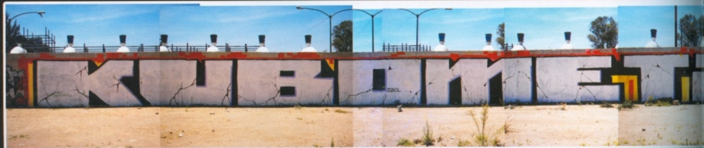
ASER7, MESH, METAL, KUBO.