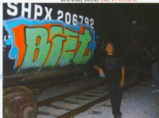
BIETH. DE MEXICO EN CHICAGO.