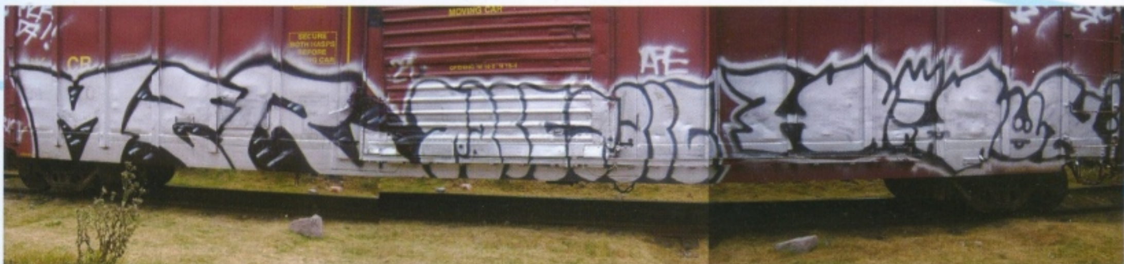
MER, PARCK 29K, HIOSE.