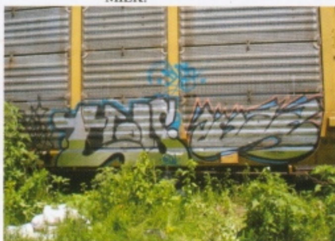
TROIS GUADALAJARA, CUAS NBC.