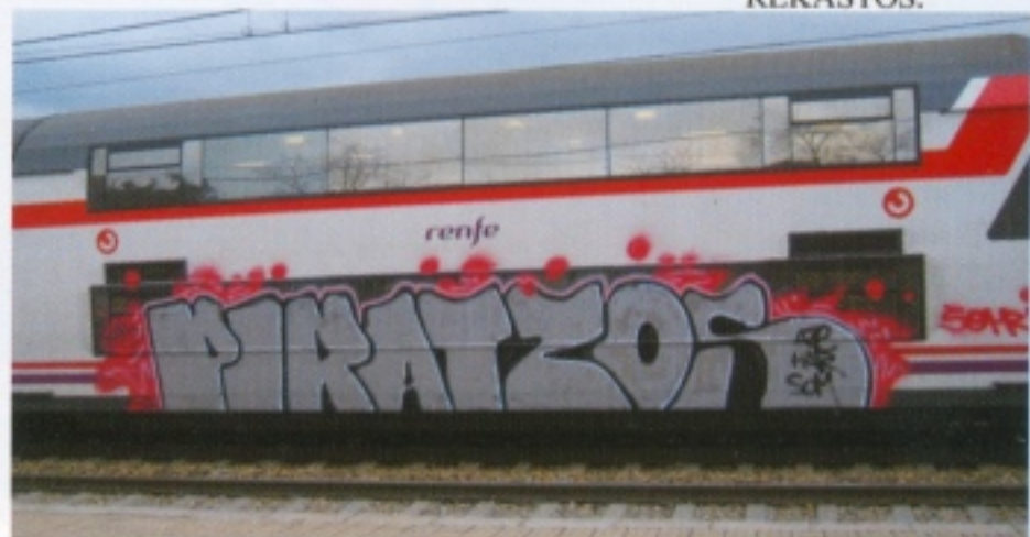
AZE "PIRATES CREW" ESPAÑA.