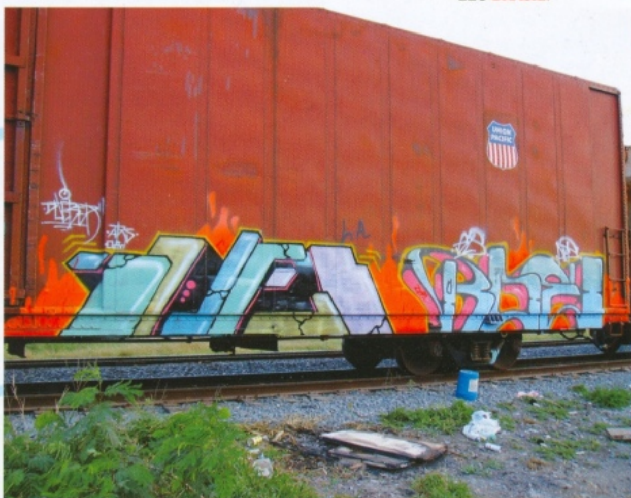
DUEB, ROE REYNOSA.