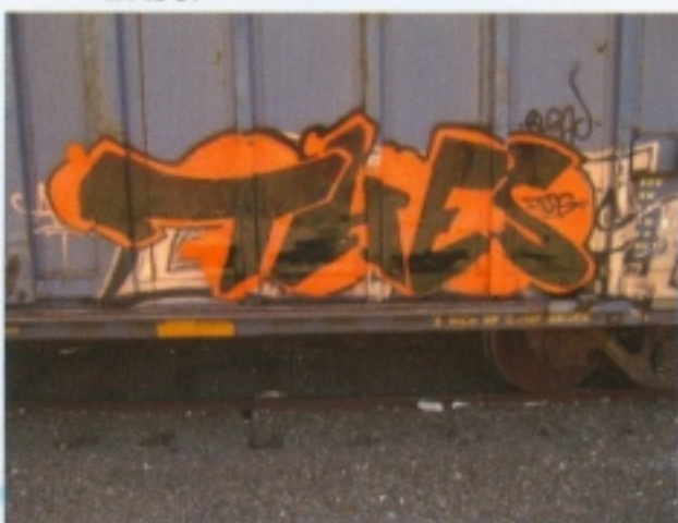
THES DE GUADALAJARA EN CALIFORNIA.