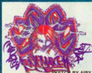
SKETCH BY AI BY