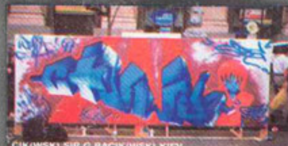
CIK(WSK) SIR G BACIK(WSK) KIEV