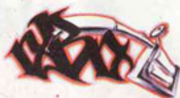
SKETCH BY DENIS