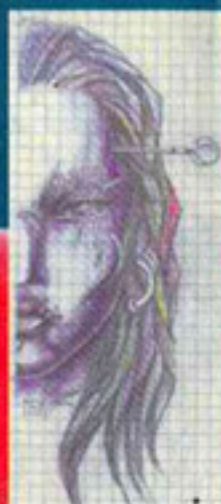
SKETCH BY GONZO