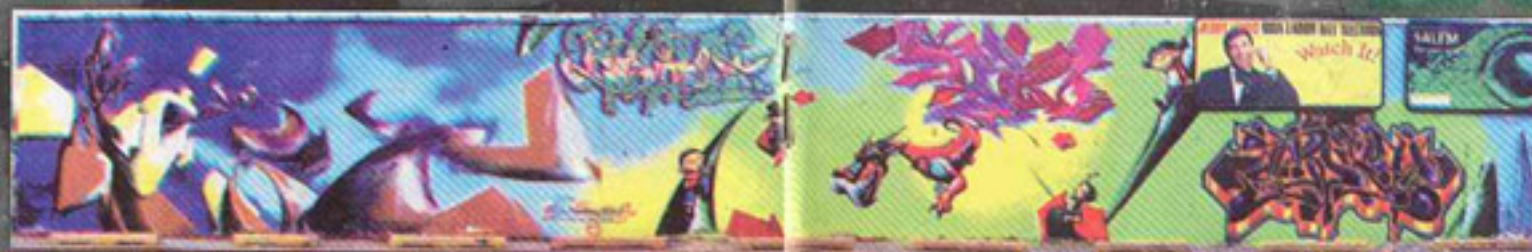
FX CREW (NEW YORK)