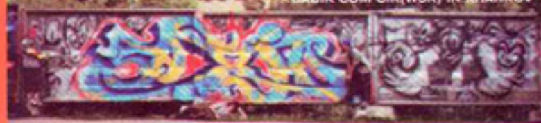
BACIK COM CIK(WSK) IN KHARKOV

хоперами (TEKILL). Центральною подією того року став спільний з хоперами bombing в центрі міста (вул.Крилова). За 90хвилин CIK встиг вкрити фарбою чималу площу стін, незважаючи на дощ та "Boys In Blue".