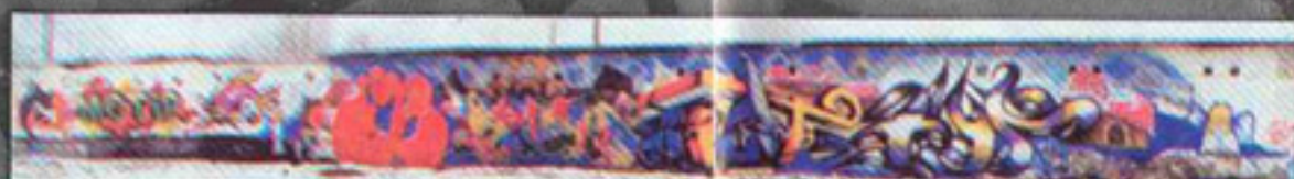
COM(WSK) STOG(SPG) CIK(WSK) MOIC18 BACIK(WSK) LUTSK