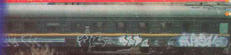
CBC & JOINT

DENIS: CBC молоде (йому біля року), але досить прогресивне crew. До зустрічі з BACIK'ом я мав непогану академічну підготовку