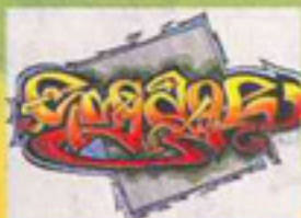
SKETCH BY HILL