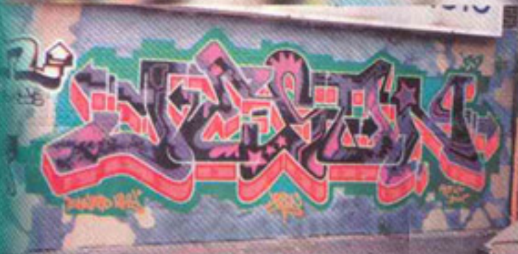
AKWART WHY -JASON-