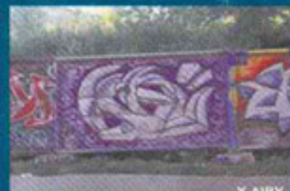
X AI BY