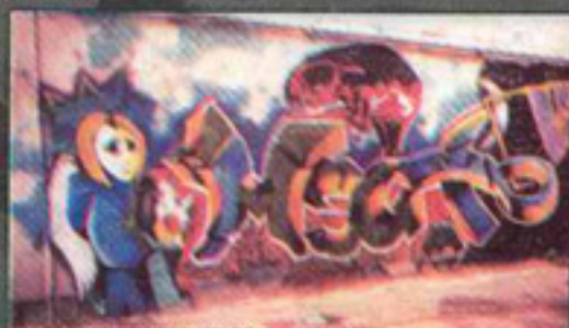
CIK(WSK) DENIS(CBC) LUTSK