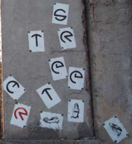
K.I., A.P., Fester