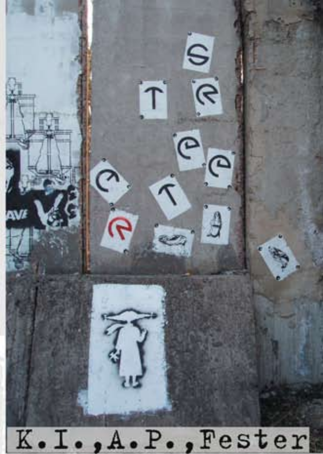
K.I., A.P., Fester