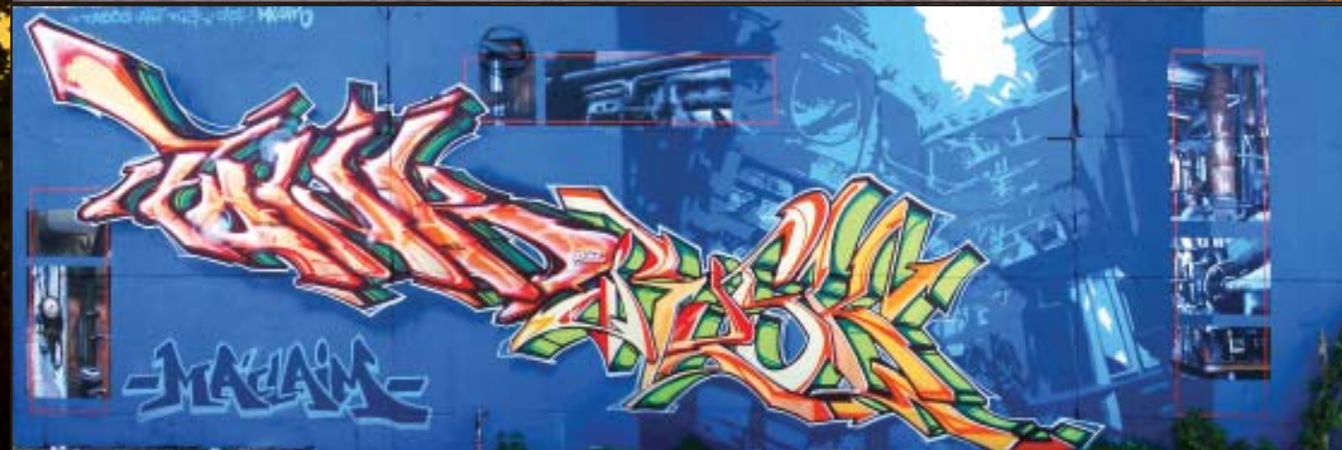
:clockwise: paw - codeak - stuka - power - dare - daim [braunschweig] a superfresh train next to hamburg maclaim featuring funk [bagdaddddd] a bombed bruxells car a french birthdaypresent for saint saint [france] diik - hefs - neasonne [rotterdam]